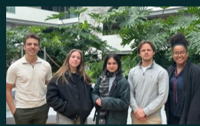
Studenten presenteren onderzoek masterscriptie bij het Ministerie van Financiën in het kader van het duurzaamheidsproject