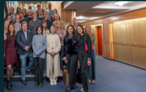
Onderzoekers geven lezing en doen onderzoek voor Europese instellingen.